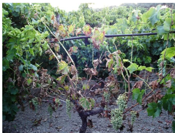
Εικ.3. Μαρασμός πρέμνου

Η ένταση των συμπτωμάτων μπορεί να αυξομειώνεται από έτος σε έτος αλλά μετά από μερικά χρόνια οδηγεί στον μαρασμό του πρέμνου και τελικά στην ξήρανσή του (Εικ.3.).