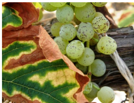
Εικ.4. Συμπτώματα σε φύλλα και σταφύλια

Οι ρώγες στις λευκές ποικιλίες σταφυλιών εμφανίζουν στιγματώση (μικρές μαύρες - μπλε κηλίδες) κατά την έναρξη της ωρίμανσης (Εικ.4.).