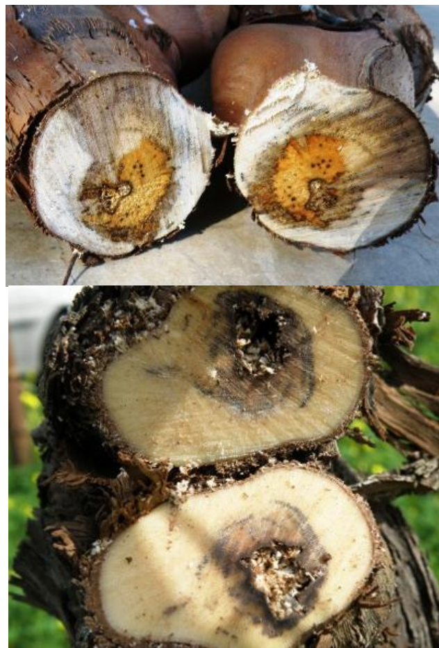
Εικ.5. Μεταχρωματισμός ξύλου

Η αποσάθρωση του ξύλου (εύθρυπτο - σπογγώδες) και ο διαχωρισμός από το υγιές ξύλο με ζώνη σκούρου αποχρωματισμού, προσδιορίζουν την ασθένεια.