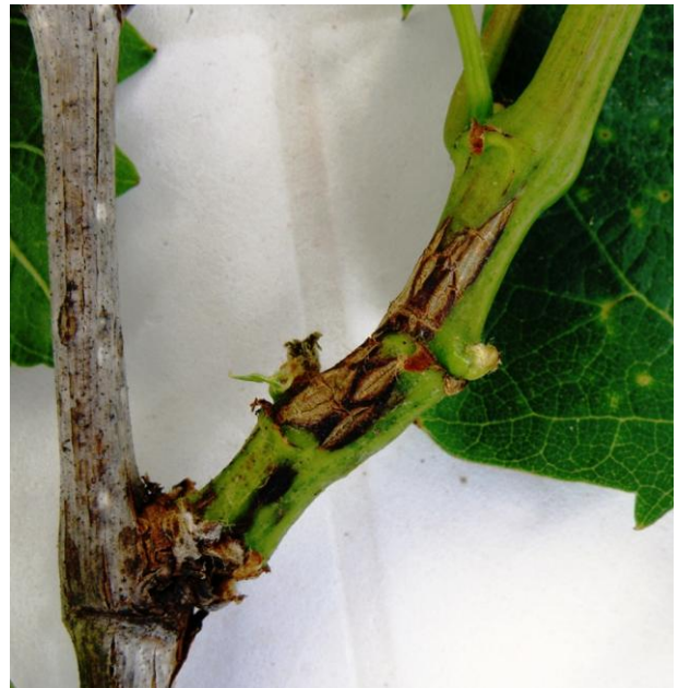
Εικ.4. Βλαστός προηγούμενου έτους με πυκνίδια και προσβολές σε νέο βλαστό