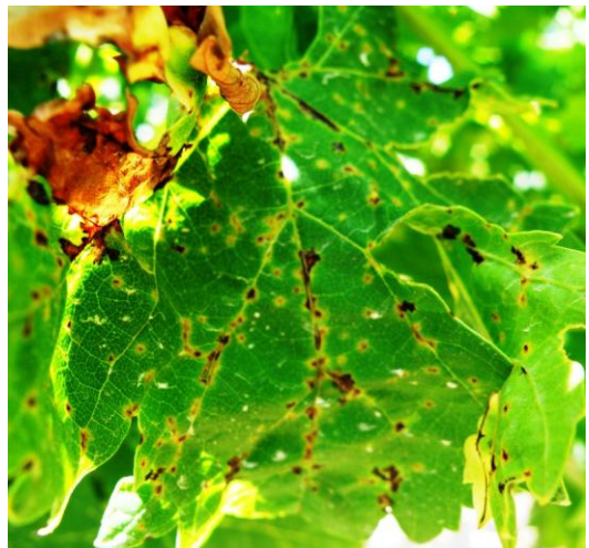
Εικ.1. Προσβολές σε φύλλο

Στη βάση του ελάσματος και επάνω στα νεύρα μικρές κυκλικές κηλίδες, κίτρινες στην περιφέρεια και μαύρες στο κέντρο (Εικ.1). Φύλλα έντονα προσβεβλημένα ξεραίνονται, το έλασμα πέφτει αλλά ο μίσχος συνήθως μένει στον βλαστό.