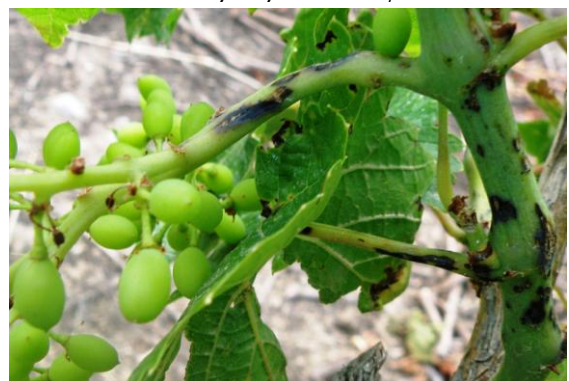
Εικ.2. Προσβολές σε ράχη σταφυλιού και σε βλαστό

Μαύρες κηλίδες στη ράχη (άξονες). (Εικ.2). Το τμήμα κάτω από την προσβολή ξεραίνεται.