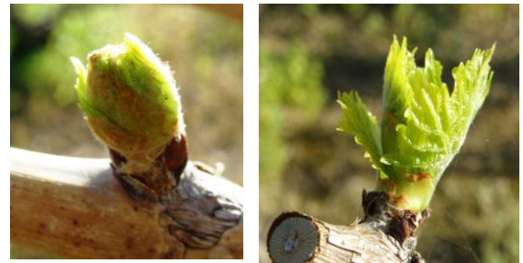
Πράσινη κορυφή - έξοδος φύλλων (στάδια C - D) Ευαίσθητα βλαστικά στάδια

*Σημείωση. Η χημική αντιμετώπιση απαιτείται σε αμπέλια που έχει διαπιστωθεί η ασθένεια και εφόσον αναμένεται βροχή κατά τα ευαίσθητα στάδια.