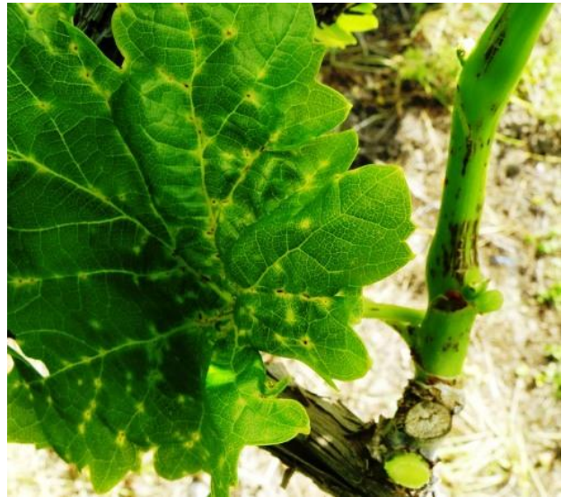
Εικ.3. Προσβολές σε βλαστό και φύλλο

Οι ταξιανθίες αποβάλλουν γρήγορα τα άνθη τους.